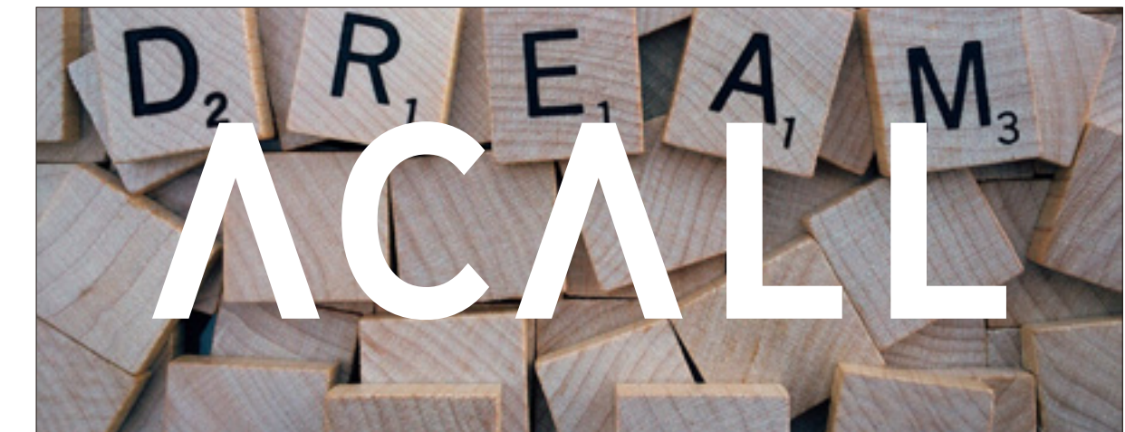
× テキストを含む背景